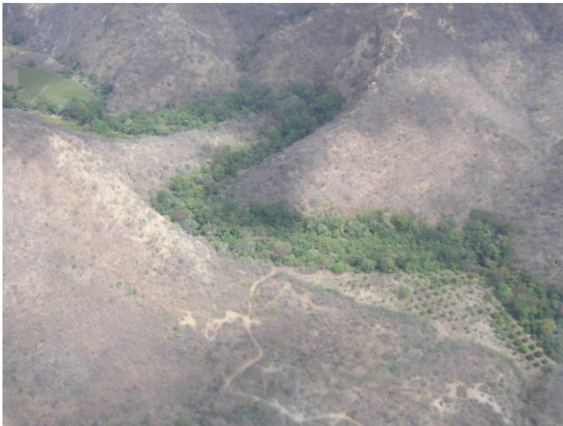
Figura 2. Bosque de galería y bosque seco en el valle de Montagua

Las condiciones climáticas de la región han causado el desarrollo de comunidades vegetales caducifolias cuyas hojas caen al inicio de la estación seca y brotan al inicio de la estación lluviosa (TNC & FDN 2003). Las especies que presentan espinas conforman aproximadamente el 50% de la composición vegetal de la región, explicando el nombre de la zona de vida monte espinoso (Castañeda & Ayala 1996). A excepción de los bosques de galería, en donde el flujo constante de agua permite el desarrollo de comunidades vegetales muy distintas y siempre verdes, las partes bajas de la región, están dominadas por especies con espinas como cactáceas, Acacia , y arbustos leguminosos (Powell & Palminteri 2001). La Figura 2 muestra la cuenca de un río en época seca y el bosque de galería que se mantiene verde. En los bosques de galería, el flujo constante de agua permite el desarrollo de comunidades vegetales que se mantienen verdes aún en época seca, y que funcionan como refugio a muchas especies de animales"]].