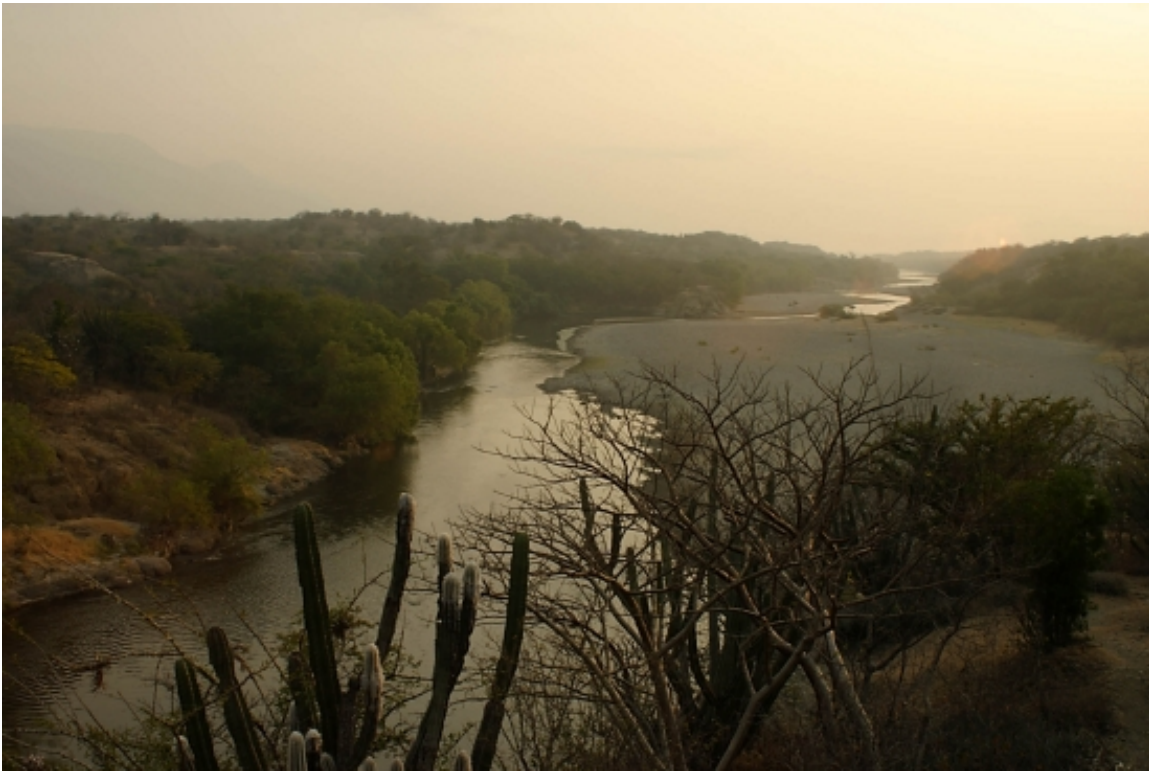
Figura 5. La región semiárida del valle del Motagua, a pesar de su importancia y singularidad, se encuentra muy amenazada y muy poco representada en el sistema guatemalteco de áreas protegidas