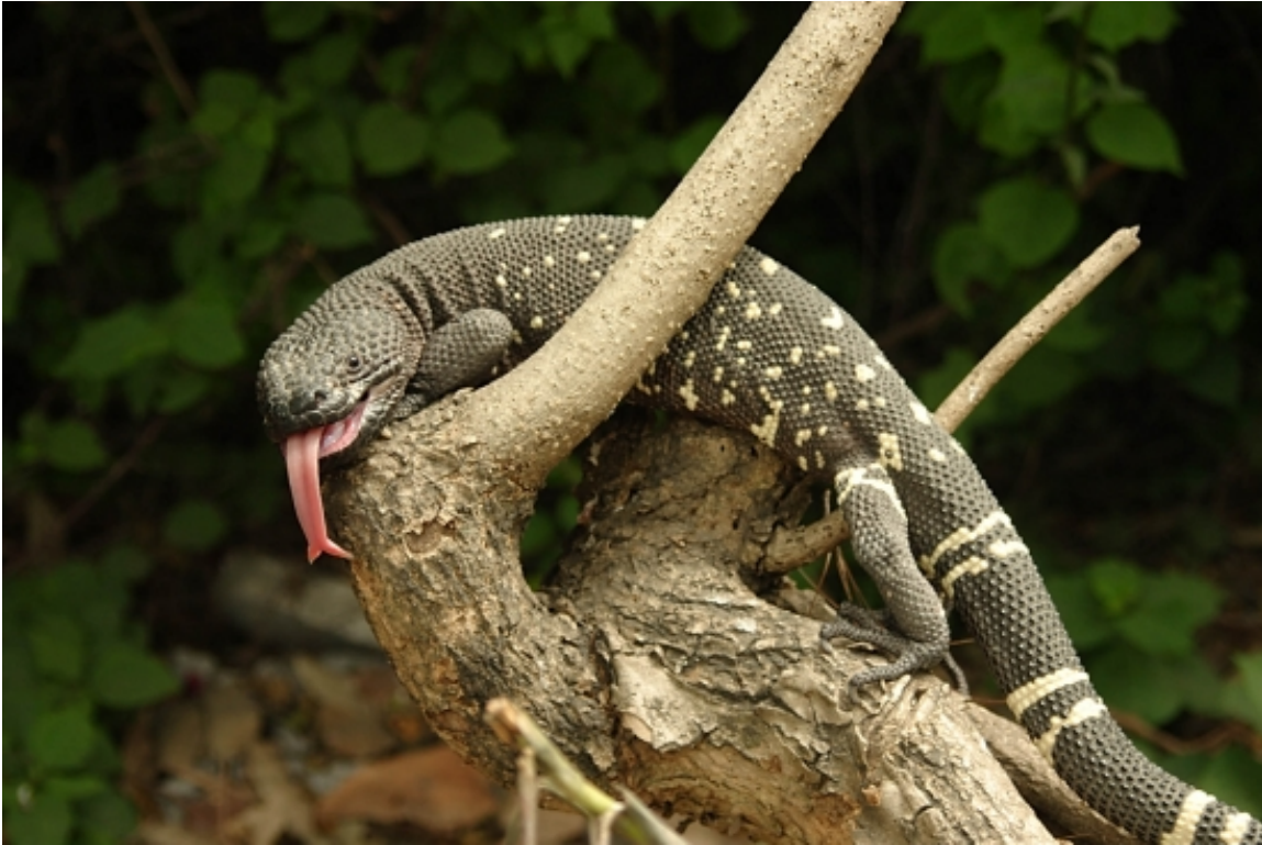
Figura 6: Heloderma horridum charlesbogerti , subespecie endémica del valle del Motagua

galería y (5) el sistema fluvial. En estos cinco elementos y en los procesos ecológicos clave que permiten su continuidad, son en los que se enfocan los esfuerzos de conservación, emprendidos a nivel de campo desde el año 2004, en la Región Semiárida del valle del Motagua. Dos de los elementos de conservación se muestran en las Figuras 6 y 7.