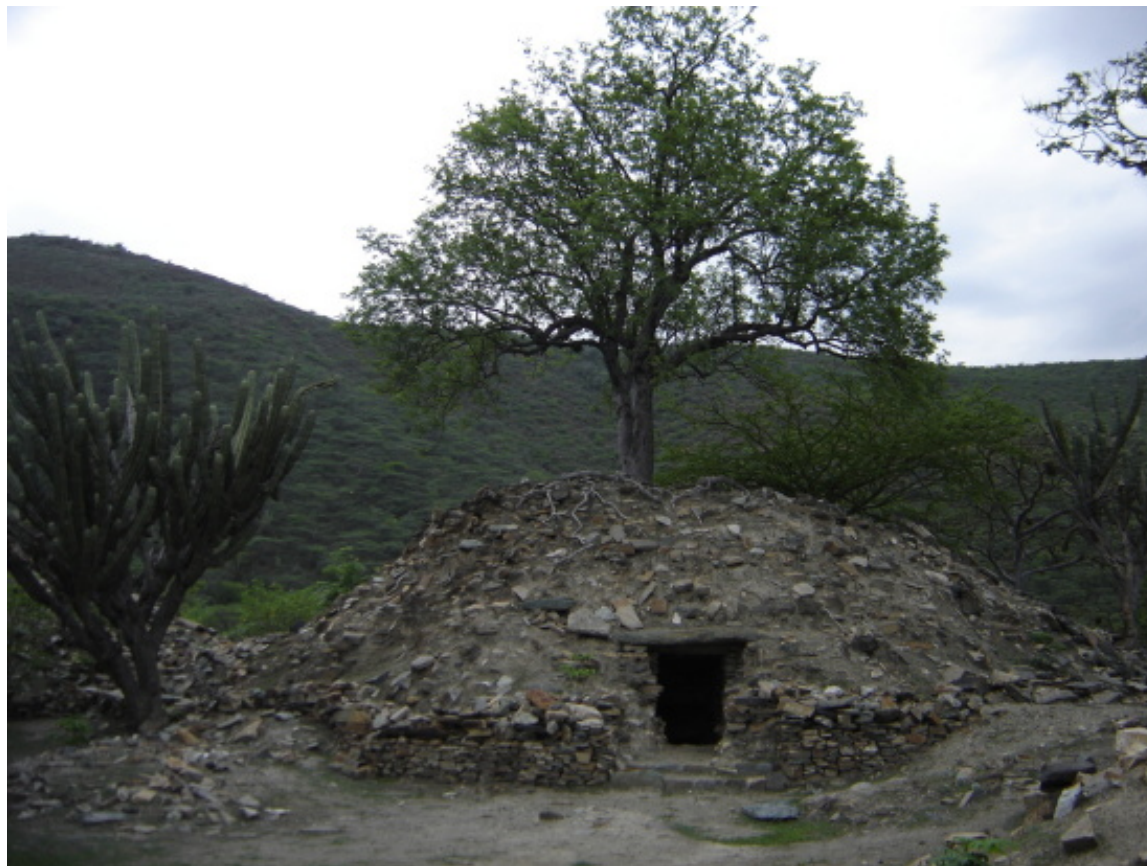
Figura 8. Los sitios arqueológicos del valle del Motagua como éste, llamado Guaytán, son uno de los elementos de conservación culturales que se han identificado.

Para un mejor avance en cumplimiento de los objetivos planteados, recientemente se ha desarrollado un plan de conservación del patrimonio cultural, que se ha integrado al PCA y que pretende aprovechar las sinergias existentes entre naturaleza y cultura, para aumentar el apoyo institucional y local, la educación y la promoción del turismo sostenible (Figura 8). Ahora, este Plan de Conservación natural y cultural (FDN y TNC 2005), por integrar tan diversos actores e instituciones locales, ha favorecido también la conformación de la Alianza para la conservación de la región semiárida del valle del Motagua . Esta alianza tiene como objetivo el promover y coordinar acciones de conservación del patrimonio natural y cultural del valle del Motagua, así como ampliar gestiones de apoyo en organismos nacionales e internacionales para la implementación del PCA. También pretende realizar incidencia política y establecimiento de alianzas estratégicas con instituciones clave y gobiernos locales, para continuar trabajando en la aplicación de la legislación ambiental vigente, la conservación y recuperación de áreas prioritarias, la organización social y la educación ambiental, con el fin de promover y consolidar mecanismos que favorezcan la permanencia del patrimonio natural y cultural del valle del Motagua.