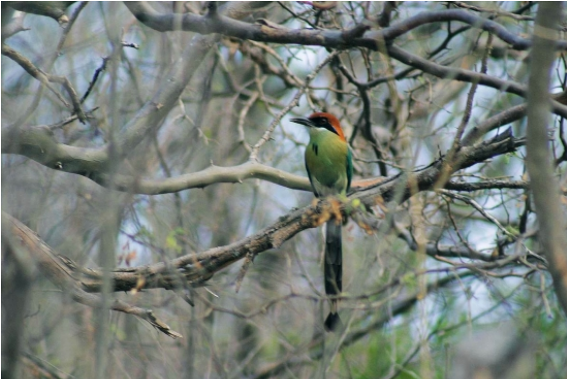
Figura 4. El valle del Motagua es el único sitio de distribución del Momotus mexicanus en Centroamérica

generalistas y poco sensibles a la perturbación del hábitat.