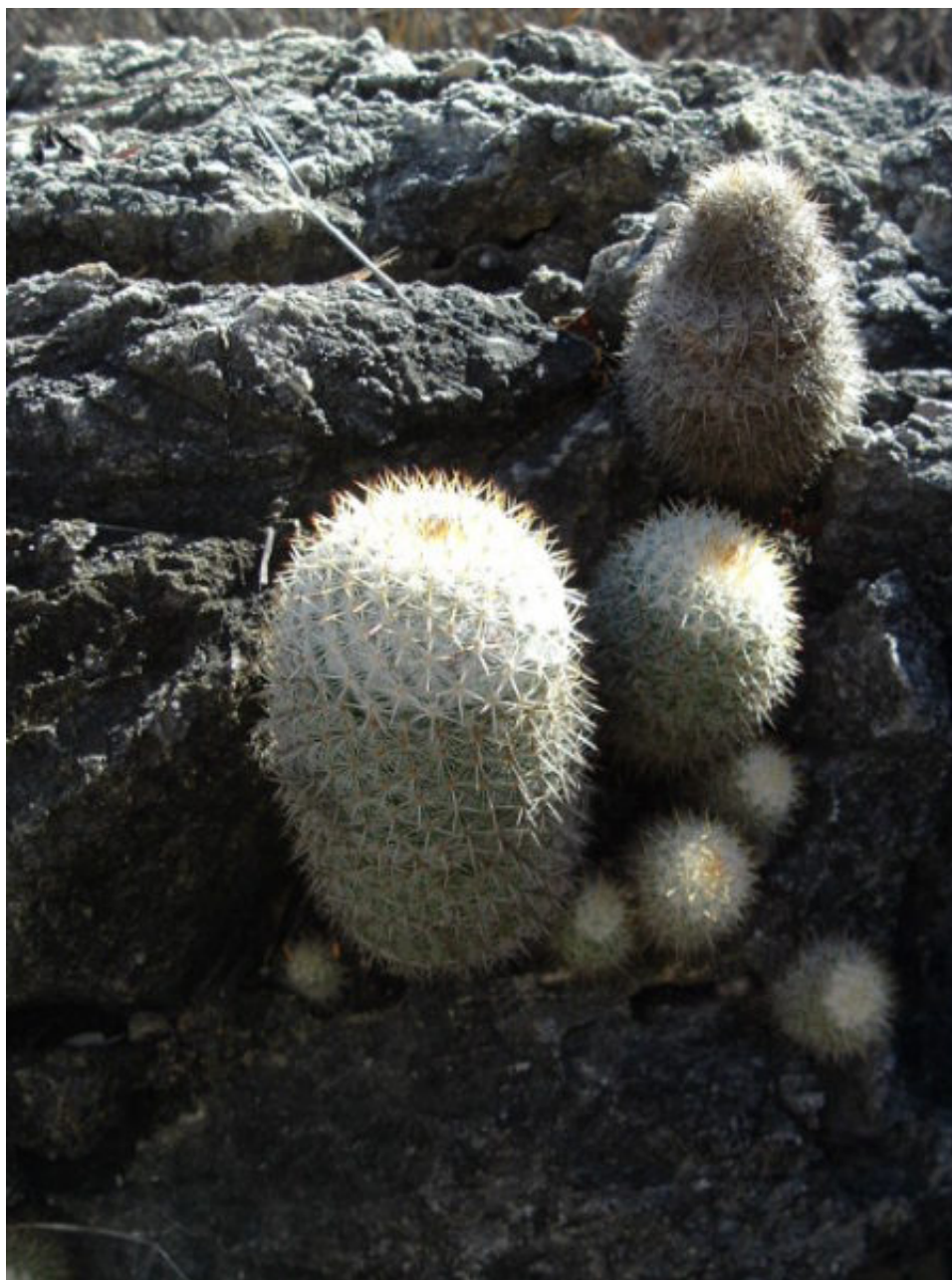
Figura 7. Cactáceas amenazadas por extracción